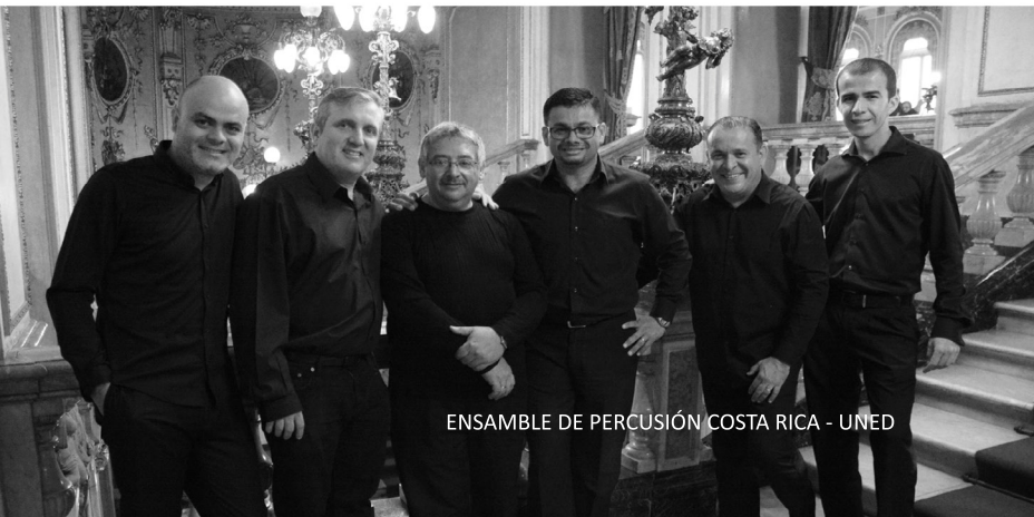
ENSAMBLE DE PERCUSIÓN COSTA RICA - UNED